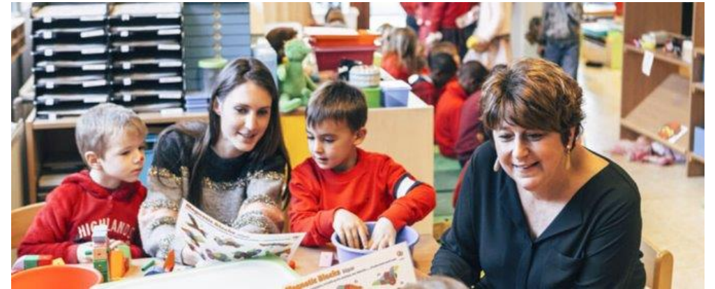
Basisschool KA Zottegem (Klasse, 2020)